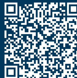
Mapa de Fundaciones de CECA 2024

Diez años después de la Ley de Cajas de Ahorros y Fundaciones Bancarias