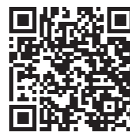
Vídeo de Fundaciones 2025