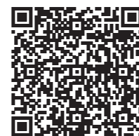
Memoria de Fundaciones 2025