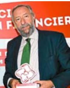
ñeda, de CECA, entrega a (Relaciones Institucionales en Madrid), el primer premio Financiera para Escolares.