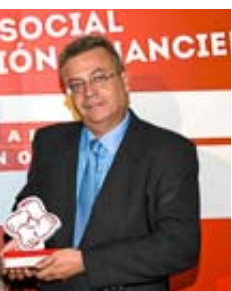
dia, de Unidad Editorial, nández, director de la Caja de Canarias, primer Ambiente.